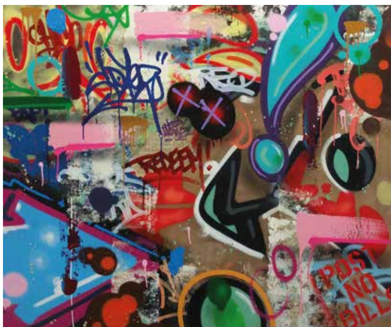
Cope2 Redeem - Aérosol acrylique et encre sur toile - 115x140cm - 2016 / Collection particulière - Paris